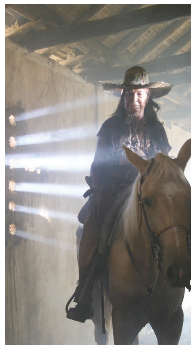
En total, 82 largometrajes podrán ser disfrutados, de manera completamente gratuita, por el público durante estos seis días

Ya los preparativos están listos para lo que será el próximo Festival de Cine Latinoamericano y Caribeño, a celebrarse entre el próximo jueves 01 y martes 06 de octubre en Margarita, estado Nueva Esparta. Esta fiesta de las imágenes en movimiento se encuentra organizada por la Fundación Distribuidora Nacional de Cine Amazonia Films, ente adscrito al Ministerio del Poder Popular para la Cultura.