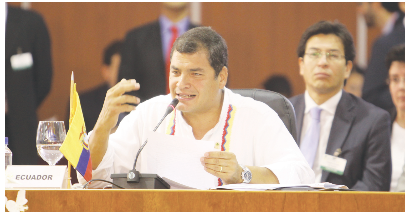
El presidente de Ecuador, Rafael Correa, indicó la necesidad de crear un sistema de financiamiento para las regiones

El ministro de Estado de Marruecos, Mohamed El Yazghi, expresó que la Cumbre es una cadena de éxitos para los países que la integran, ya que las propuestas del Sur son grandiosas para impulsar la política, la economía, y el acercamiento a través del diálogo entre ambos continentes.