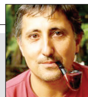
La Canalla Mediática

2) Para más información, en inglés, ver: Infotainment Society: Junk Food News and News Abuse. http://www.projectcensored.org/articles/story/infotainment-society-junk-food-news-and-news-abuse-for-2008-2009 .