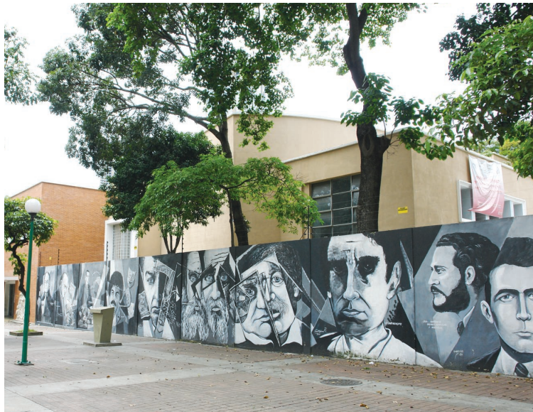
El pueblo es quien propone los bienes culturales.