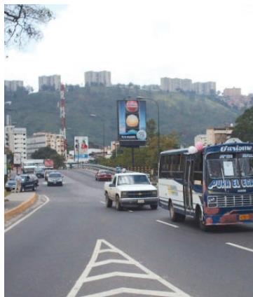
Puente Los Leones recibe reconocimiento