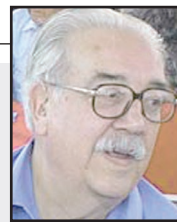
La Canalla Mediática